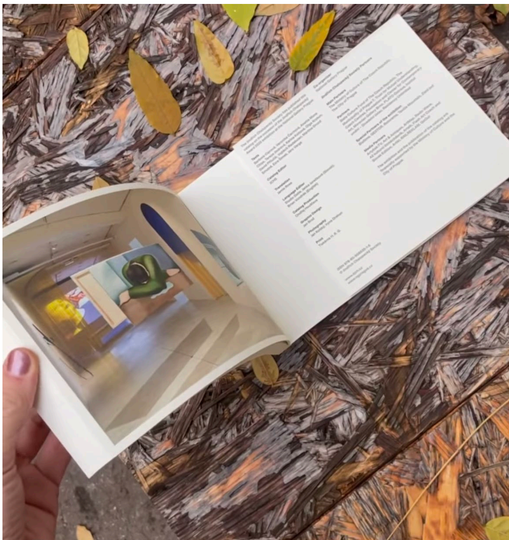
Katalog k Ceně Jindřicha Chalupického 2022, grafický design: Jan Brož

Součástí katalogu tradičně zůstává vyjádření poroty k výběru pěti laureátek a laureátů Ceny. Publikace vyšla v nákladu 1500 ks v redakci Společnosti Jindřicha Chalupického v listopadu 2022.