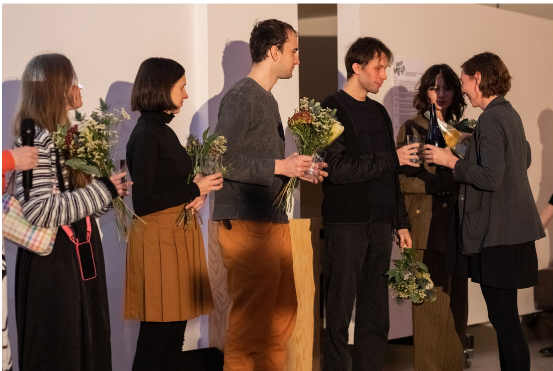
Moment slavnostního ocenění laureátek a laureátů Ceny Jindřicha Chaloupeckého 2022