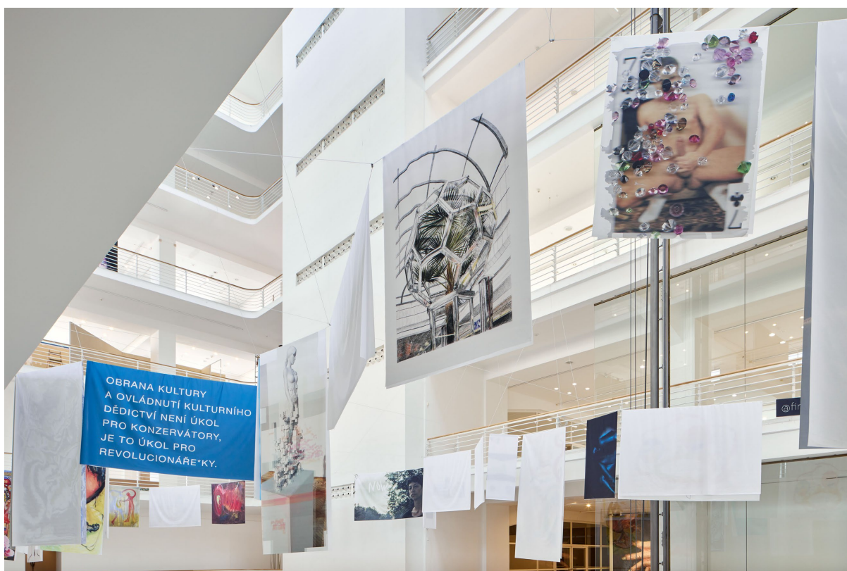
Pohled na „levitující“ výstavu umělkyně a umělců hlásících se do CJCH 2022