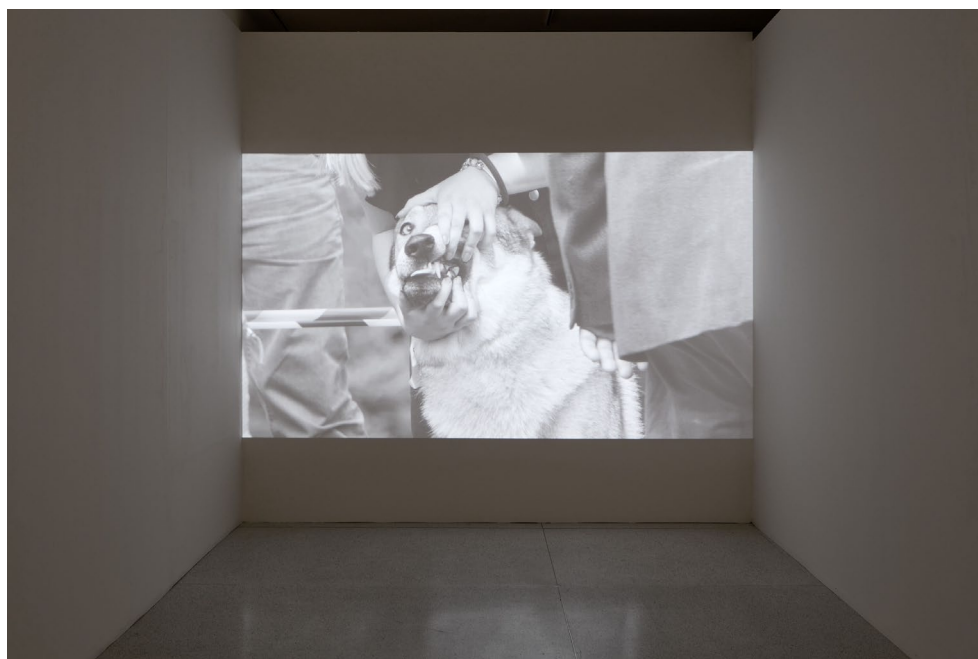
David Přílučík: Plemeno , 4K videoinstalace 22', foto: Jan Kolský

Umělecké projekty Davida Přílučíka se opakovaně zabývají zkoumáním přírody, živočichů a vztahů lidských a mimolidských bytostí. V širším měřítku lze hovořit o komplexním výzkumu na téma etické a ohleduplné existence člověka ve světě a soužití s dalšími tvory, kteří jej spolu s ním obývají. Pro výstavu CJCH 2022 Přílučík připravil nový film, navazující na jeho dvě předchozí výstavy v Čechách a na Slovensku. Ve fiktivním příběhu Plemeno se setkáváme s chovatelem československých vlčáků, který zvažuje, zda by se plemeno nemělo vyvíjet jiným směrem, čímž se dostává do konfliktu s ostatními chovateli.