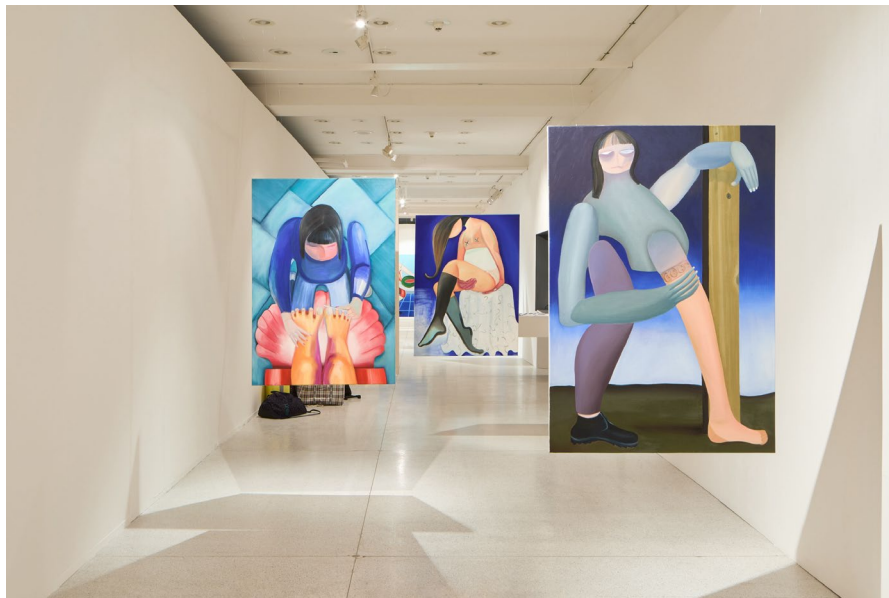
Martina Drozd Smutná: výběr maleb

Ezra Šimek se s dávkou humoru a ironie a vizuálně nápadným jazykem zapojuje do naléhavých témat nebinárnosti, genderové fluidity a souvisejících identitárních, politických a sociálních témat. Jeho*její dílo zpochybňuje stereotypy tradičních genderových rolí, často odkazem na populární západní kulturu, zejména hollywoodskou tradici.