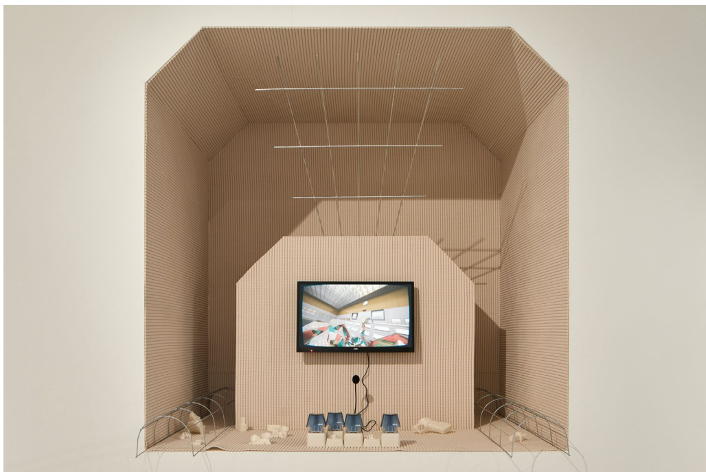
Vojtěch Radakulan: Období osamělých směn, aneb nejdražší muzeum na světě , 2022

Na výstavě ve Veletržním paláci Radakulan připravil multimediální instalaci kombinující fyzické prostředí a objekty vyprodukované pomocí 3D tiskárny se zážitkem virtuální reality v projektu nazvaném Období osamělých směn, aneb nejdražší muzeum na světě . Výchozí inspirací pro něj byla bezprecedentní situace z rakouského Zwentendorfu, kde byla v 70. letech 20. století postavena kompletní jaderná elektrárna, jež ale vlivem tlaku místní společnosti na politiky nikdy nebyla uvedena do provozu.