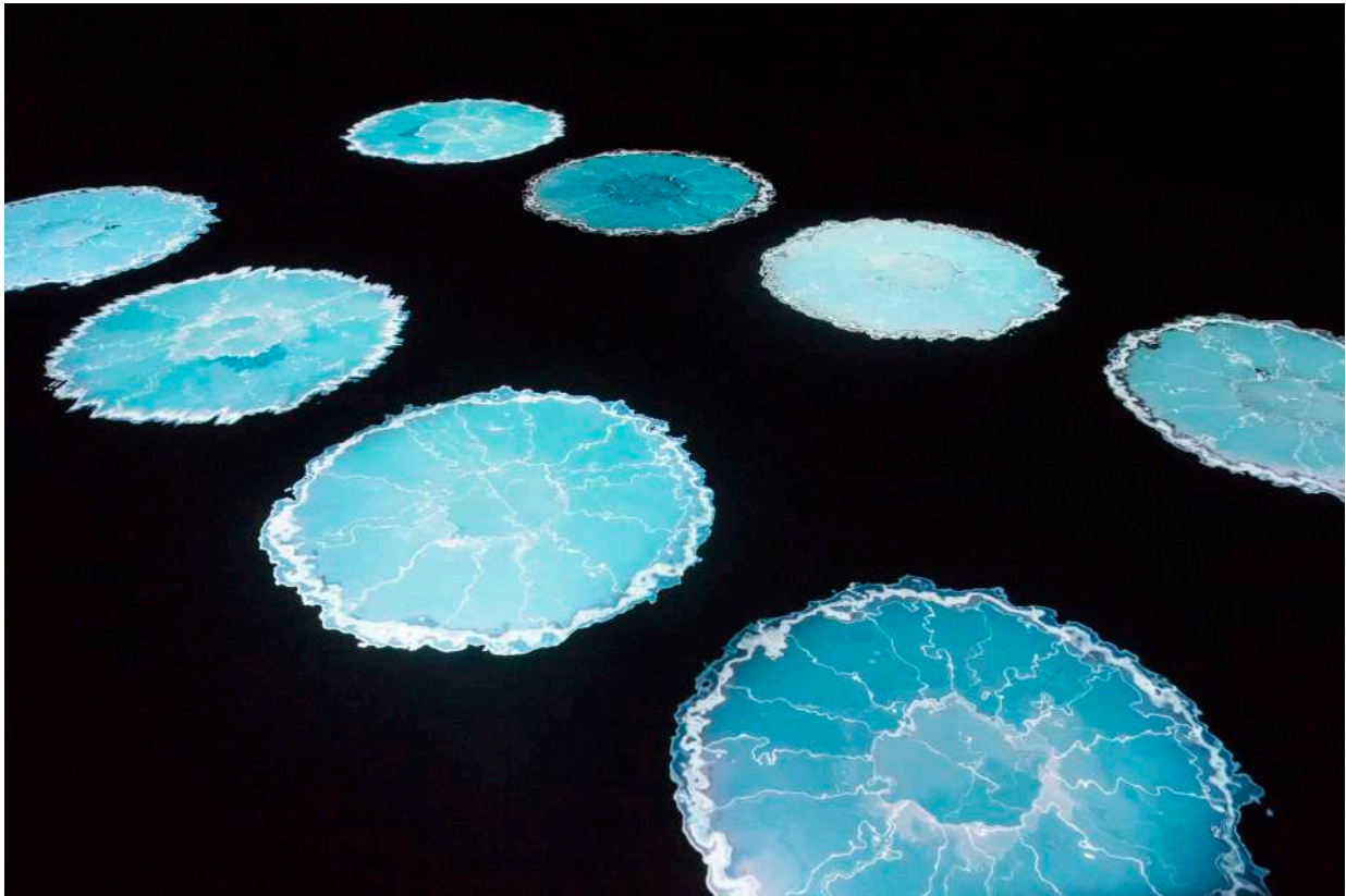
Cooking Sections – Salmon – The Traces of Escapees, instalace s 8 kanálovou projekcí